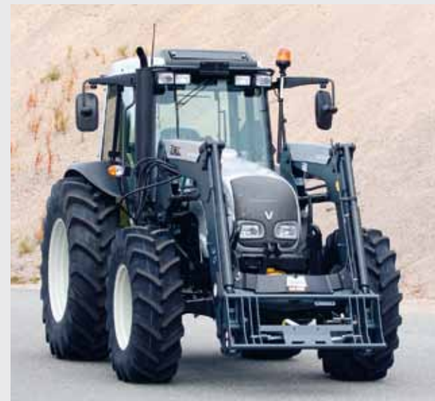
Valtra A Serie mit niedriger Kabine.

A-Serie, der A72, kann nur als Classic bestellt werden und ist die günstigste Alternative für den Einstieg in die Welt der skandinavisch geprägten Valtra-Traktoren. Wie alle anderen Valtra-Traktoren eignet sich der A72 ideal für den wirtschaftlichen Ganzjahreseinsatz auf dem Acker und im Wald.