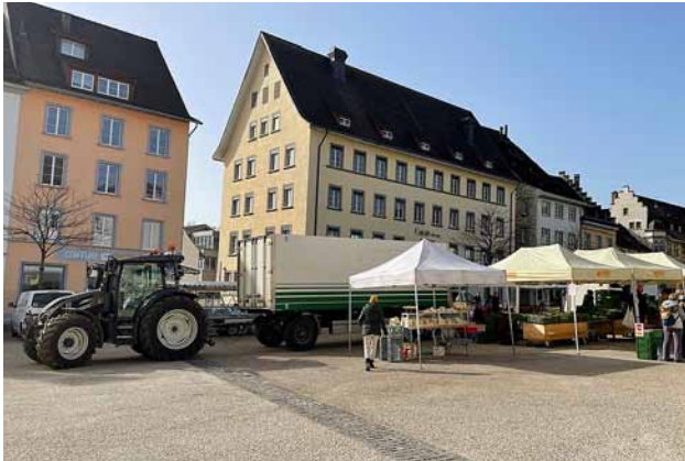
In der Schaffhauser Altstadt ist Wendigkeit gefragt.