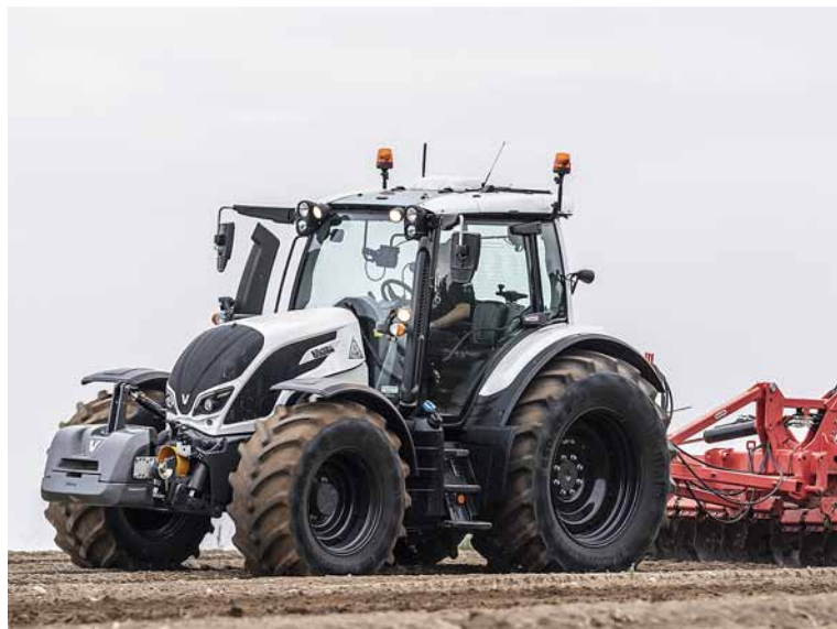
Heute ist jeder 20. zugelassene Traktor in der Schweiz ein Valtra.

B ereits 1990 hatten sich die Firmen Nomaco in Rupperswil und die GVS in Schaffhausen gleichzeitig am Import der ersten Valmet-Traktoren bzw. Valmet-Forstmaschinen versucht. Richtig begonnen hat jedoch alles am 1. Juli 1995 mit der Sisu Maschinen AG mit Sitz in Marthalen, welche speziell für den Import und den Vertrieb der bewährten finnischen Traktoren in der Schweiz gegründet wurde.