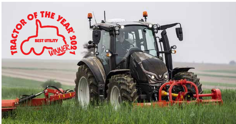
Der Valtra G135 Versu mit SmartTouch wurde beim Wettbewerb „Tractor of the Year“ zum „Best Utility“-Traktor gekürt.