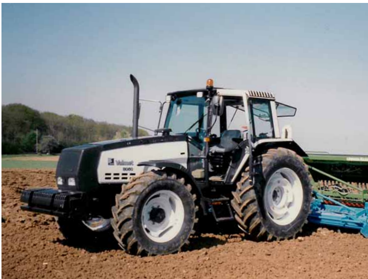
Bereits in den 90er-Jahren war der Valmet 8060 auf Schweizer Höfen zu sehen.