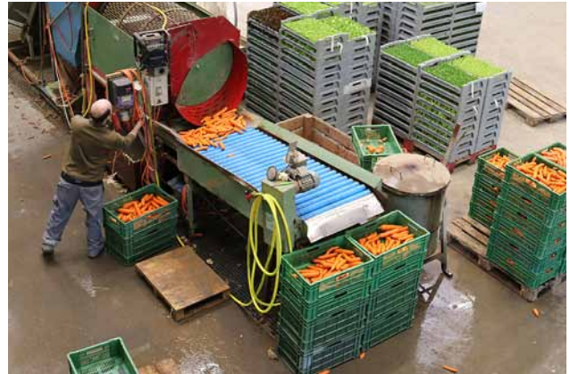
Hochbetrieb auf dem Weber-Hof: Das letzte Wintergemüse wird für den Markt gewaschen, während die Setzlinge für die kommende Saison gerichtet werden.

Auch wenn „kein Bauer gerne aufs Traktorfahren verzichten möchte“, hat Miro Weber entschieden, die Ackerarbeiten und die Pflege der Kunstwiesen einem Partnerhof zu überlassen, um sich besser auf die Produktion und den Handel vom Gemüse zu konzentrieren. Und aufs Traktorfahren muss Miro auch nicht verzichten: säen, pflanzen, ernten – es gibt so viele Arbeiten, die eine Zugmaschine erfordern!