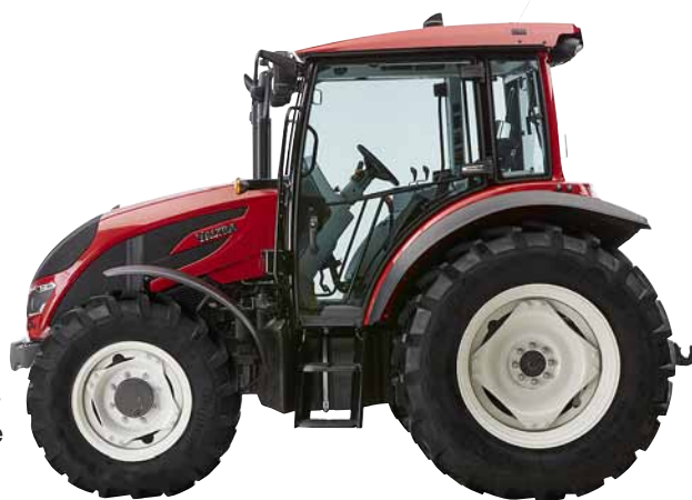
Die 5. Generation der A-Serie hat einen überarbeiteten Motor, Getriebe und Design.

In nur wenigen Jahren wurden im finnischen Werk Suolahti mehr Traktoren der A-Serie der 4.