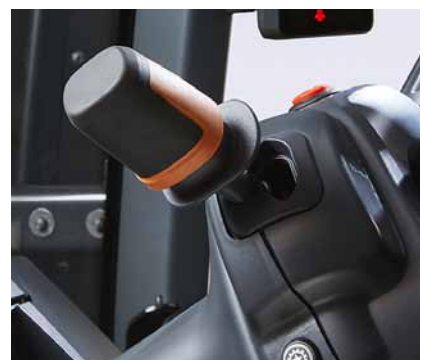
Der bekannte Wendeschalthebel von Valtra wurde aktualisiert.