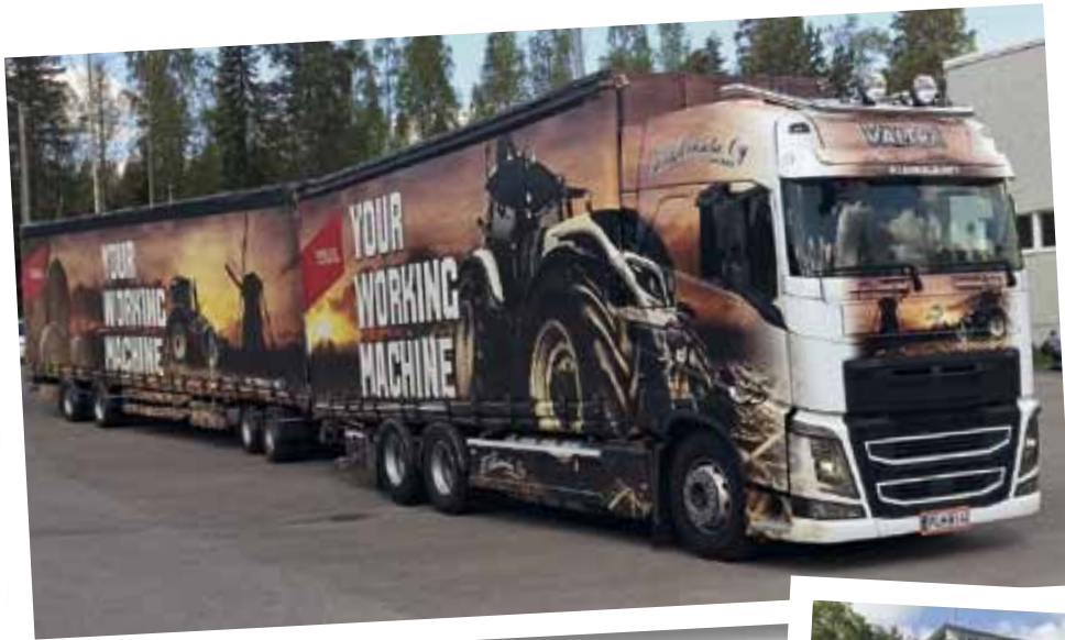
Der Truck, der in Finnland die Kabinen vom Kabinenwerk ins Traktorenwerk liefert, das Bild hat Jochen Buhrmester gemacht.