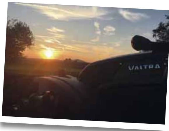
N-Serie von Christopher Jörg im Sonnenuntergang.