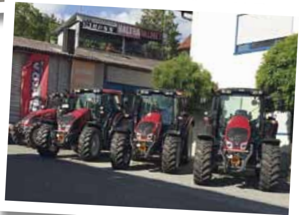
Zwar nicht 7 aber doch 4 auf einen Streich hat unser Händler Röss Landtechnik aus Bad Neustadt in einer Woche verkauft: 4 N103H3 konnten an 4 Kunden verkauft und direkt übergeben werden, da die Maschinen aus dem Bestand kamen. Wir wünschen allen 4 Valtra Fahrern allzeit gute Fahrt und viel Spaß.