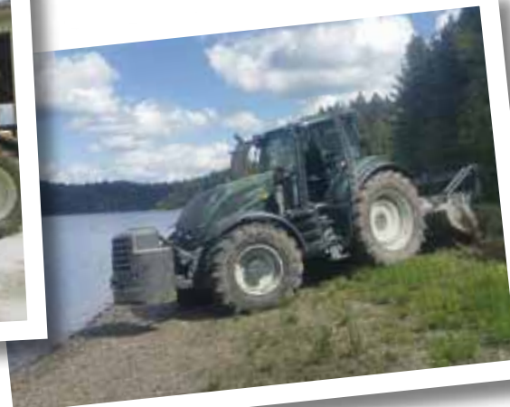
Der Fuhrpark von LU Thönnessen & Schümmer GmbH