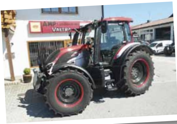
Die Fahrlehrer der Fahrschule Korn aus Mühldorf dürfen mit dem „Red Racing“ fahren, Danke an Albert Mayrhofer von AMP Landtechnik für das Bild.