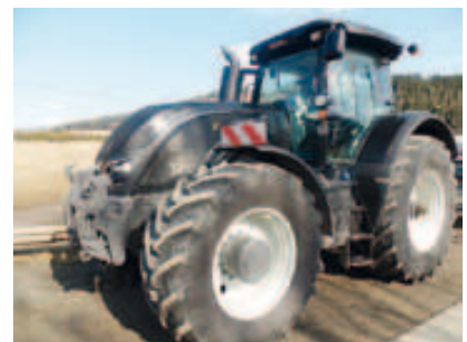
S374, Bj. 2014, 6 Zyl., 400 PS, 50 km/h Paket, FKH, Rüfa, AutoComfort Kab. fed., uvm. (2014 12)