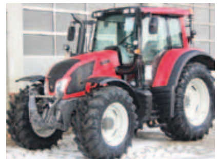
N123 Versu, Bj. 2015, 4 Zyl., 135 PS, 50 km/h Paket, FKH, Kabinenfed., Infolight uvm. (ID 2015 03)