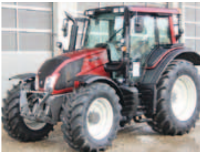
N143 HT3, Bj. 2015, 4 Zyl., 152 PS, 50 km/h Paket, FKH, Kabinenfed., Infolight uvm. (ID 2015 08)