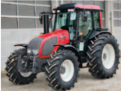
A93 HiTech, Bj. 2015, 3 Zyl., 101 PS, FKH, hydr. AHBV uvm. (ID 2015 02)