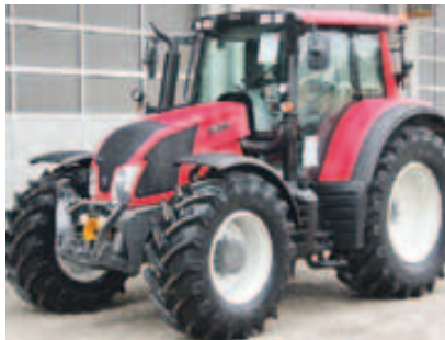
N163 Direct, Bj. 2015, 4 Zyl., 163 PS, 50 km/h Paket, FKH, FZW, Rüfa, Kabinenfed., Infolight uvm. (ID 2015 04)