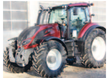
T174E Active, Bj. 2015, 6 Zyl., 175 PS, 50 km/h Paket, FKH, Kabinenfed., Infolight uvm. (ID 2015 10)