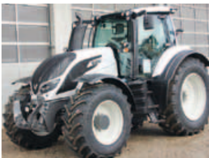
T214 Direct, Bj. 2015, 6 Zyl., 215 PS, 50 km/h Paket, FKH, Rüfa, AutoComfort Kab. fed., uvm. (ID 2015 11)