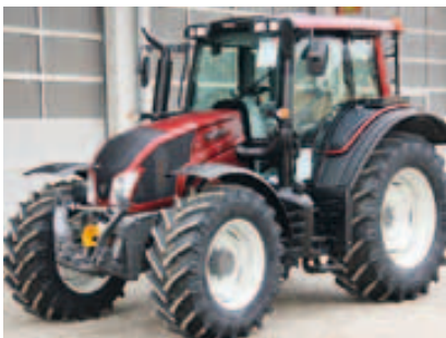
N123 HT5, Bj. 2015, 4 Zyl., 135 PS, 50 km/h Paket, FKH, FZW, Kabinenfed. uvm. (ID 2015 07)