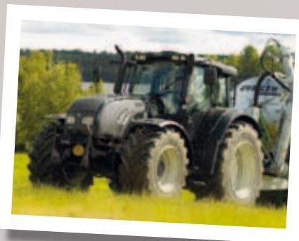
Der Valtra T202D war mit dem modernen Valtra-Stufenlosgetriebe Direct ausgerüstet, was eine Kombination von mechanischen und hydrostatischen Getriebeeinheiten ist.