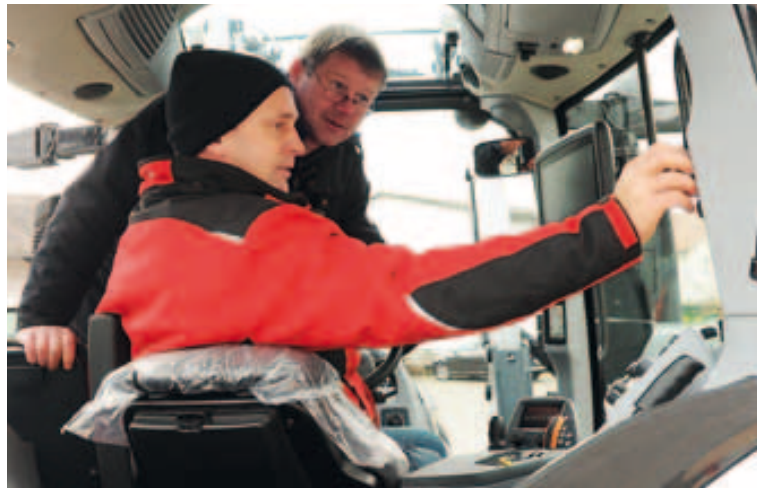
Die neue Kabine überzeugt und auch das C3000 Terminal für das AutoGuide-Spurführungssystem ist bereits installiert.

kommt. Auch das hierfür benötigte Stroh und der Hafer werden natürlich selbst erzeugt.