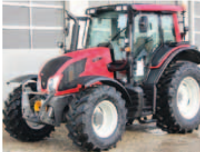
N103.4 HT5, Bj. 2015, 4 Zyl., 111 PS, EcoSpeed, Turbokupplung, FKH, Frontv.+Joystick, FZW uvm. (ID 2015 06)