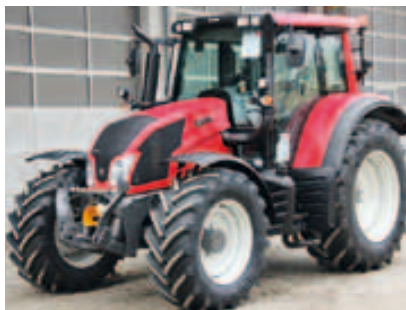
N123 Direct, Bj. 2015, 4 Zyl., 135 PS, 50 km/h Paket, FKH, FZW, Kabinenfed. uvm. (ID 2015 01)