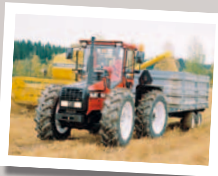
Der Valmet H800 fuhr mit einem rein hydrostatischem Getriebe und hatte auch für keine andere Funktion ein mechanisches Getriebe.

Das nächste Stufenlosgetriebe kam mit dem Valmet H800, welcher mit einem rein hydrostatischen Getriebe ausgestattet war. Jedes einzelne Rad hatte einen Radnabenmotor aus Radialkolben und einer Verstellpumpe. Die Differenzialsperre bestand aus Ventilen, die die gleiche Menge an Öl zu jedem Rad leiteten. Die Heckzapfwelle wurde ebenfalls durch einen Hydraulikmotor angetrieben, so dass der Traktor überhaupt kein festes mechanisches Getriebe hatte. Der Fahrer konnte die Geschwindigkeit durch einen Hebel oder