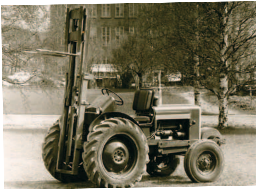
Der hydrostatische Kriechgang wurde 1966 mit dem Valmet 565 vorgestellt.

ein Pedal verändern. Der Valmet H800 war also der erste Traktor, der kein „Gaspedal“ sondern ein „Fahrpedal“ hatte.