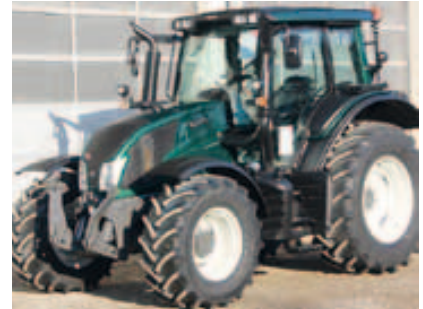
N103.4 HT5, Bj. 2015, 4 Zyl., 111 PS, EcoSpeed, FKH, Frontv.+Joystick, Kab.fed. uvm. (ID 2015 13)