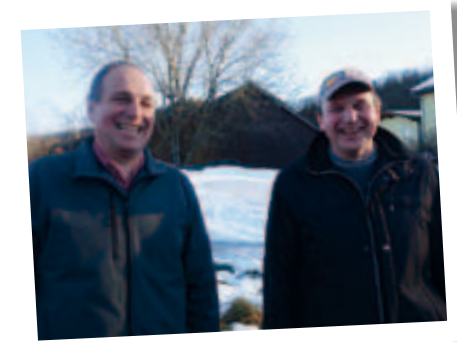
„Kum und schau dir den an,“ hat der Berndl dem Jaglecker gesagt, nachdem er im Frühjahr seinen Valtra N123 bekommen hatte.

Erfahrungen mit dem Valtra austauschte hörte man von Gastgeber: „Das stufenlose Getriebe is scho an Gschicht.“