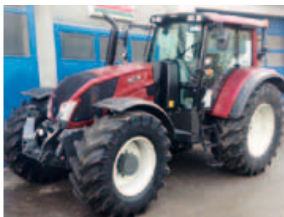
NX163, Bj. 2015, 4 Zyl., 163 PS, Unlimited Knicklenkung inkl. VA-Stabilisierung, 50 km/h Paket, Rüfa, uvm. (2015 09)