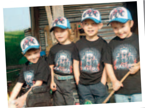
Vier Valtra-Freunde mit ihrer „Uniform“, aufgenommen von unserem Händlermitarbeiter Robert Kleidorfer von der BFW Landtechnik in Pfaffenhofen.