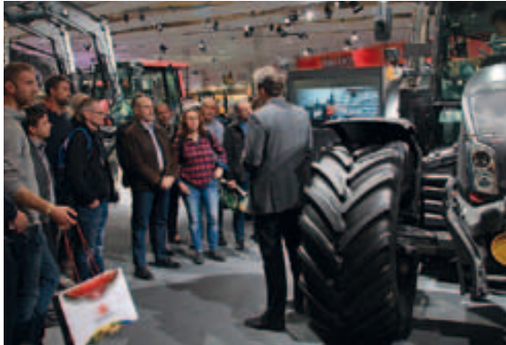
Die breiteste Valtra-Modellpalette lockte viele Besucher auf den Valtra-Stand.