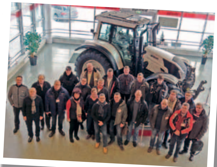
Das Verkaufsteam der RWZ beim Besuch des Valtra-Werkes in Finnland – eine motivierte Truppe.