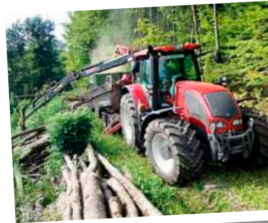
Firma Pfitzenmaier aus Strümpfelbach bei Backnang mit ihrem Valtra S293 und Lochner-Hacker im Einsatz.

Valtra-Treffen in den Landkreisen Neu-Ulm / Mindelheim: Kunden unseres Händlers Mayer Landmaschinen aus Unterroth haben sich zu einer Sternfahrt mit anschließendem Beisammensein getroffen. Valtra – eine starke Marke die verbindet.