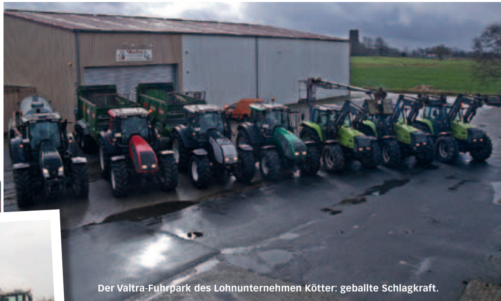
Der Valtra-Fuhrpark des Lohnunternehmens Kötter: geballte Schlagkraft.