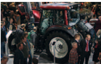
Viele Gespräche wurden geführt.