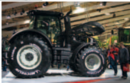
Die neue S-Serie – beeindruckend.