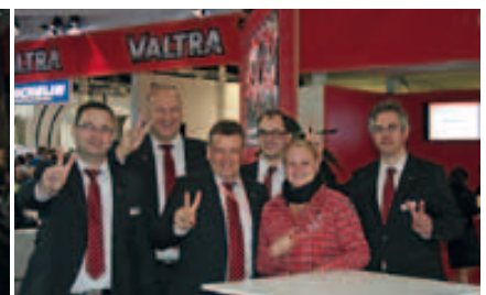
Es ist vorbei – zufriedene Valtra-Mitarbeiter nach dem Abhupen.