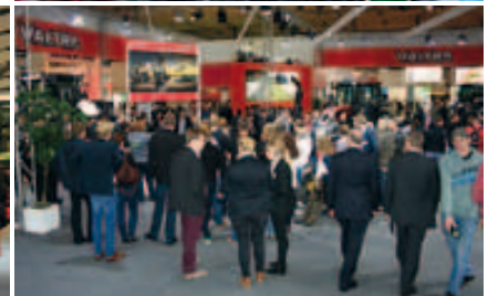
Der Valtra-Stand war offen und immer gut besucht.