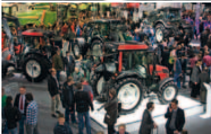
Blick vom Balkon auf den Valtra und AGCO Stand.