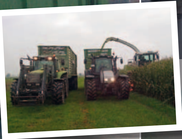
Der T151H und einer der 8550 beim Mais-Häckseln.