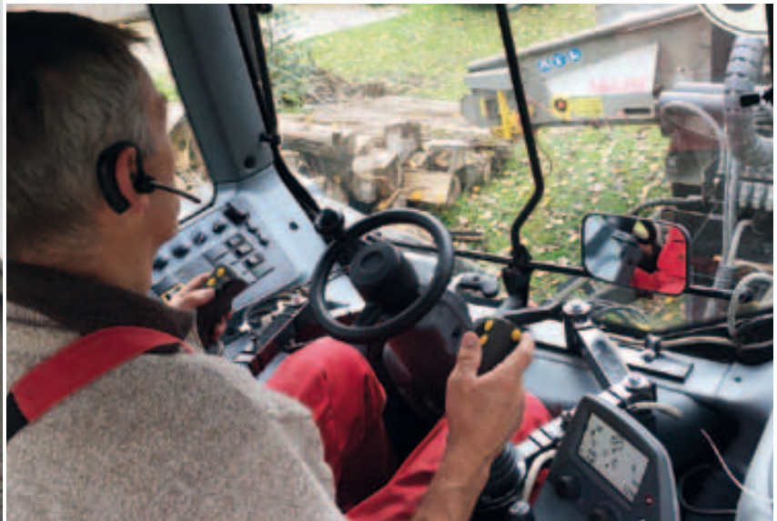
Die tolle Kransteuerung wurde vor der Auslieferung noch von Firma Rieger angebaut.