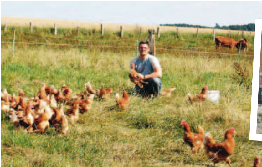
Die Legehennen der Familie Soost lassen es sich im Freigehege gut gehen. Mehr Infos finden Sie unter http://www.hof-soost.de .