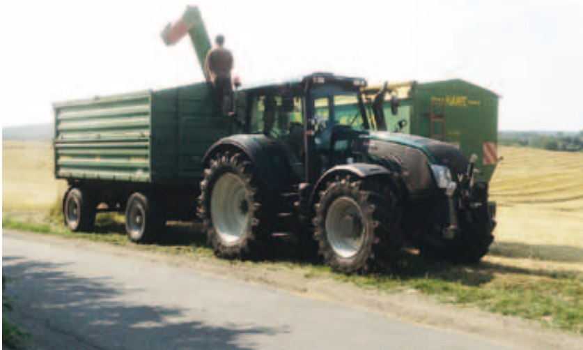
Der Valtra wurde gleich bei der Getreideernte und der anschließenden Bodenbearbeitung eingespannt.

schaftet aktuell etwa 300 ha Fläche. Auf den Flächen werden hauptsächlich Winterweizen, Wintergerste und Raps angebaut, bei Getreide strebt man einen Ertrag von 85–90dt im 5-Jahres-Schnitt an. Der Großteil der Ernte wird direkt an den Landhandel vermarktet, ein kleiner Teil wird aber auch zur Fütterung der 2000 Legehennen verwendet, die in Bodenhaltung mit Freilaufmöglichkeit gehalten werden. Die Eier werden direkt an Privatabnehmer oder über Zwischenverkäufer wie Bäckereien vermarktet.