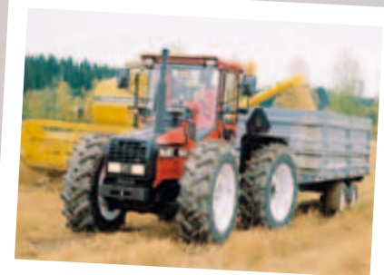
Der Valmet H800 fuhr mit einem rein hydrostatischem Getriebe und hatte auch für keine andere Funktion ein mechanisches Getriebe.

Das nächste Stufenlosgetriebe kam mit dem Valmet H800, welcher mit einem rein hydrostatischen Getriebe ausgestattet war. Jedes einzelne Rad hatte einen Radnabenmotor aus Radialkolben und einer Verstellpumpe. Die Differenzialsperre bestand aus Ventilen, die die gleiche Menge an Öl zu jedem Rad leiteten. Die Heckzapfwelle wurde ebenfalls durch einen Hydraulikmotor angetrieben, so dass der Traktor überhaupt kein festes mechanisches Getriebe hatte. Der Fahrer konnte die Geschwindigkeit durch einen Hebel oder