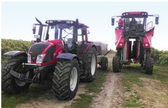
Der N123 H5 im Einsatz bei der Weinlese.