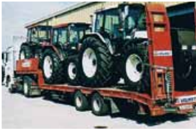
Der erste eigene Valmet-Vorfühzug.