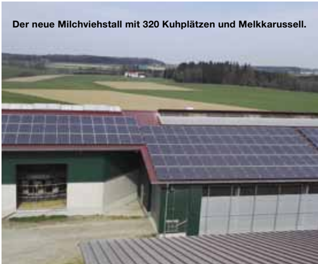
Der neue Milchviehstall mit 320 Kuhplätzen und Melkkarussell.