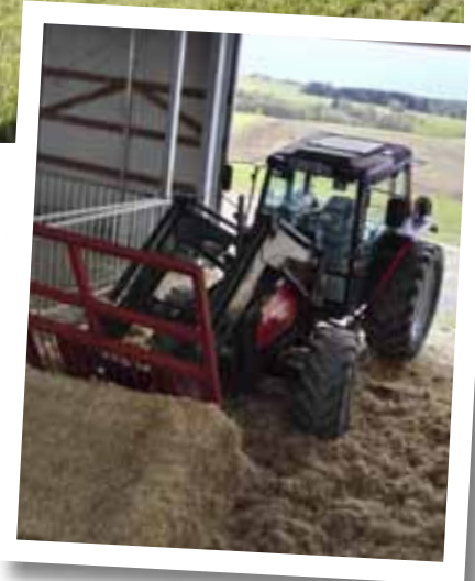
Der Valmet 6400 mit über 18.000 Betriebsstunden beim Einstreuen.

technik aus Gammertingen/Kettenacker die Betreuung des Betriebes Gaum. Die vier Traktoren sind nach wie vor alle im Einsatz, um die Arbeiten auf dem Milchviehbetrieb zu erledigen.