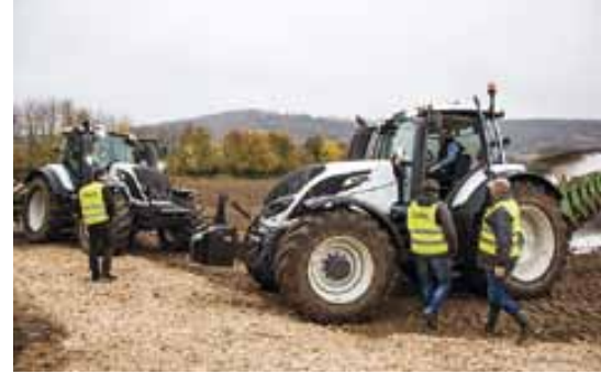
Die Vorstellung der neuen T4-Serie war ein großer Schritt im Jahr 2014. Unsere Händler wurden sowohl in der Theorie als auch in der Praxis geschult.

Der Plan ging auf und die Verkaufszahlen stiegen Jahr für Jahr von anfangs 36 auf 74 bis zu 174 im dritten Jahr. Die Weiterentwicklung des Valtra Vertriebs in Deutschland kam in großen Schritten voran und wurde von entscheidenden Umfirmierungen begleitet. Aus den ehemaligen Valmet-Traktoren wurde zunächst SISU Valmet und anschließend Valtra-Valmet. 1999 wurde der Firmensitz der deutschen Vertriebsgesellschaft nach Hannover-Langenhagen verlegt, auf das Firmengelände des ehemaligen Schwesterunternehmens Partek Cargotec GmbH (heute Hiab GmbH). Zum 50jährigen Firmenjubiläum 2001 wurde der Name schließlich zu Valtra geändert. Im Jahr 2004 dann der nächste große Schritt: die Eingliederung in den AGCO-Konzern. Damit folgte im Jahr 2007 auch die Rückkehr nach Bayern, diesmal ins Allgäu an den AGCO-Standort in Marktoberdorf, an dem auch noch heute der Sitz des Valtra Teams ist. Im Jahr 2011 wurden schließlich alle AGCO-Vertriebsgesellschaften in die AGCO Deutschland GmbH eingegliedert.