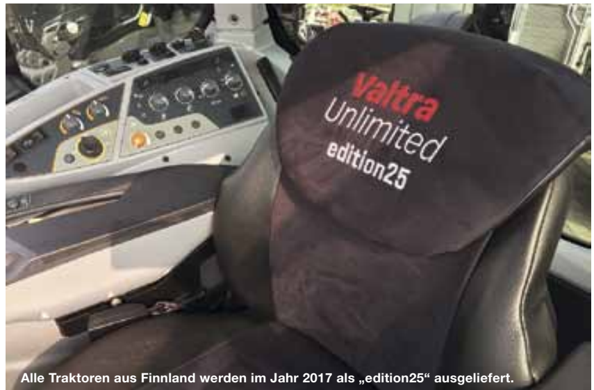
Alle Traktoren aus Finnland werden im Jahr 2017 als „edition25“ ausgeliefert.

Für uns als Valtra Team ist es seither nicht ruhig geworden, die Modelle der 4. Generation kommen sowohl bei Valtra-Fahrern als auch bei neuen Mitgliedern in der Valtra Familie gut. Dazu wollen 25 Jahre Valtra Deutschland gefeiert werden und so werden alle Traktoren aus dem finnischen Werk im Jahr 2017 als „edition25“ ausgeliefert. Das bedeutet, dass alle Traktoren kostenfrei über unser Unlimited Studio mit einer Vielzahl an Jubiläumsoptionen wie einem Fußraumteppich, einem Alcantara-Sitzbezug und Plaketten mit „edition25“ Logo ausgestattet werden. Wir sind gespannt, wie viele Traktoren diese Ausstattung bekommen und freuen uns gleichzeitig auf die nächsten 25 Jahre. •