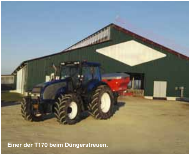
Einer der T170 beim Düngerstreuen.