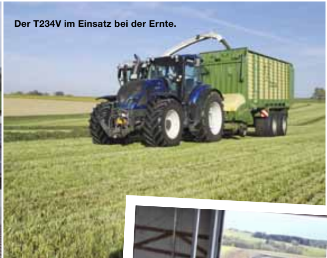
Der T234V im Einsatz bei der Ernte.