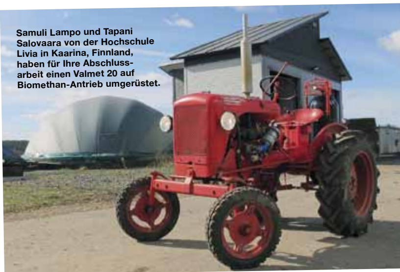
Samuli Lampo und Tapani Salovaara von der Hochschule Livia in Kaarina, Finnland, haben für Ihre Abschlussarbeit einen Valmet 20 auf Biomethan-Antrieb umgerüstet.

“Am einfachsten kann man einen Valmet 15 von einem Valmet 20 an der Spurstange unterscheiden. Beim Valmet 15 befindet sich diese vor der Vorderachse, beim Valmet 20 dahinter.”