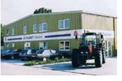
Die erste Zentrale der Valmet Traktoren GmbH in Ergolding bei Landshut.