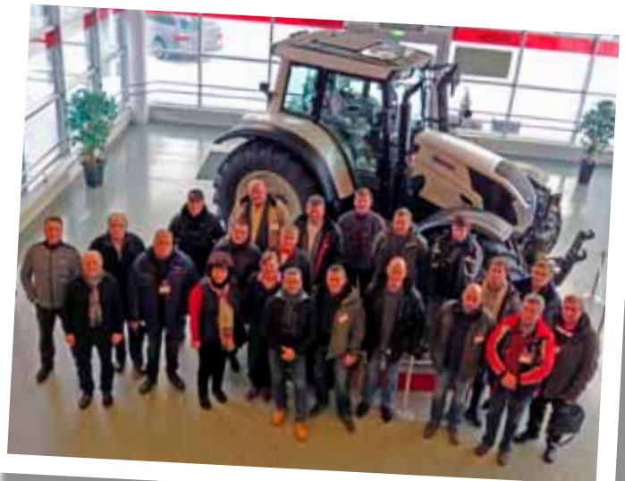
Das Verkaufsteam der RWZ beim Besuch des Valtra-Werkes in Finnland – eine motivierte Truppe.