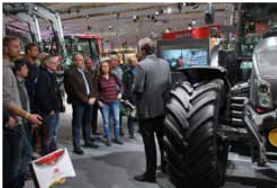
Die breiteste Valtra-Modellpalette lockte viele Besucher auf den Valtra-Stand.