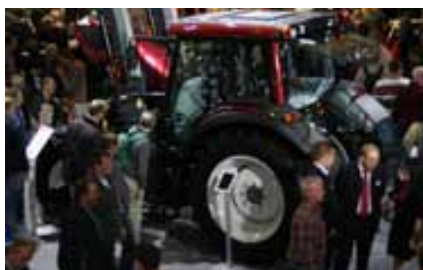
Viele Gespräche wurden geführt.