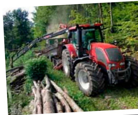
Firma Pfitzenmaier aus Strümpfelbach bei Backnang mit ihrem Valtra S293 und Lochner-Hacker im Einsatz.

Valtra-Treffen in den Landkreisen Neu-Ulm / Mindelheim: Kunden unseres Händlers Mayer Landmaschinen aus Unterroth haben sich zu einer Sternfahrt mit anschließendem Beisammensein getroffen. Valtra – eine starke Marke die verbindet.