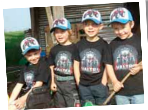
Vier Valtra-Freunde mit ihrer „Uniform“, aufgenommen von unserem Händlermitarbeiter Robert Kleidorfer von der BFW Landtechnik in Pfaffenhofen.