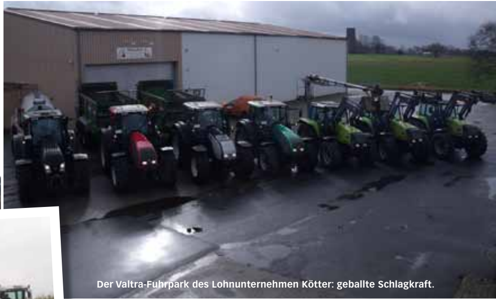
Der Valtra-Fuhrpark des Lohnunternehmens Kötter: geballte Schlagkraft.