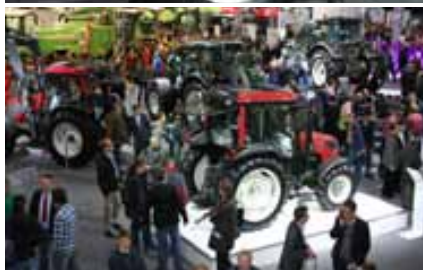
Blick vom Balkon auf den Valtra und AGCO Stand.