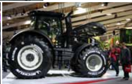
Die neue S-Serie – beeindruckend.