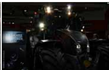
Abhupen mit dem Unlimited – wir freuen uns auf die Agritechnica 2015.