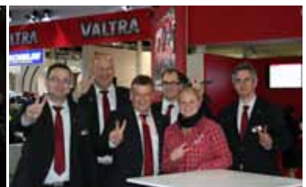
Es ist vorbei – zufriedene Valtra-Mitarbeiter nach dem Abhupen.