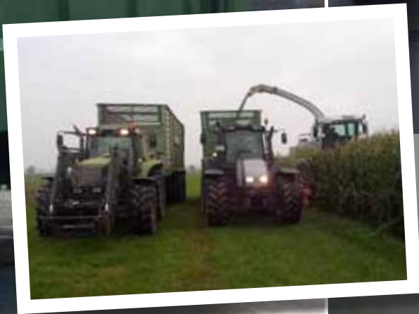
Der T151H und einer der 8550 beim Mais-Häckseln.