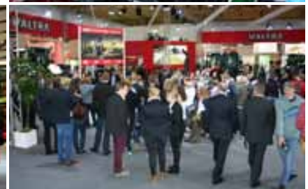
Der Valtra-Stand war offen und immer gut besucht.