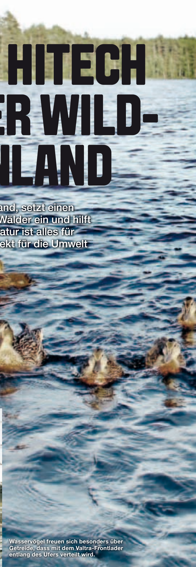
Wasservögel freuen sich besonders über Getreide, dass mit dem Valtra-Frontlader entlang des Ufers verteilt wird.