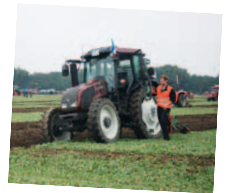
Die Einstellungen müssen immer wieder angepasst werden. Mehr Infos finden Sie unter http://www.pfluegerrat.de/ oder www.historische-furche.de

TEXT ACHIM KRAUSKOPF / THOMAS LESCH