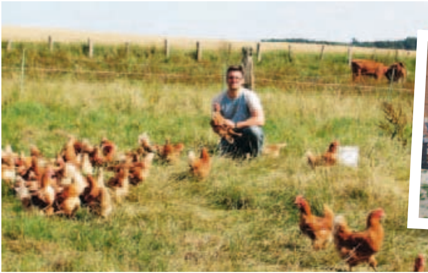
Die Legehennen der Familie Soost lassen es sich im Freigehege gut gehen. Mehr Infos finden Sie unter http://www.hof-soost.de .