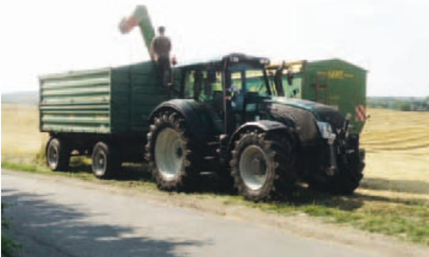
Der Valtra wurde gleich bei der Getreideernte und der anschließenden Bodenbearbeitung eingespannt.

schaftet aktuell etwa 300 ha Fläche. Auf den Flächen werden hauptsächlich Winterweizen, Wintergerste und Raps angebaut, bei Getreide strebt man einen Ertrag von 85–90dt im 5-Jahres-Schnitt an. Der Großteil der Ernte wird direkt an den Landhandel vermarktet, ein kleiner Teil wird aber auch zur Fütterung der 2000 Legehennen verwendet, die in Bodenhaltung mit Freilaufmöglichkeit gehalten werden. Die Eier werden direkt an Privatabnehmer oder über Zwischenverkäufer wie Bäckereien vermarktet.