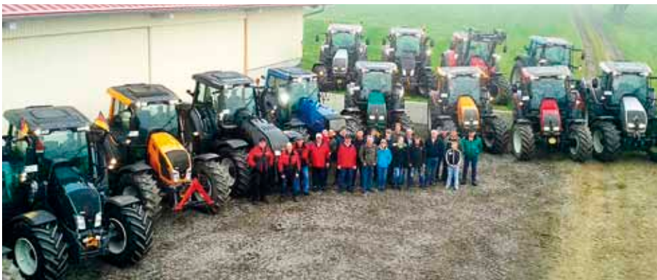
Das 2. Valtra Treffen unseres Händlers Mayer aus Unterroth. Während diese Ausgabe des Valtra Teams im Druck war, haben die Jungs bereits das 3. Treffen abgehalten. Wir freuen uns auf die Bilder mit noch mehr finnischen Traktoren 😊.

keit – die neue T-Serie begeistert. Wir wollen uns natürlich trotzdem weiter entwickeln und so haben die Finnen viel Feedback aus den Gesprächen von Deutschland mit in das Werk genommen und wollen damit die nächsten Produkte noch näher an Ihre Anforderungen anpassen. Freuen Sie sich darauf. •