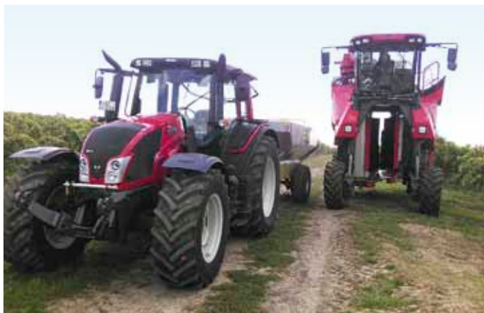
Der N123 H5 im Einsatz bei der Weinlese.