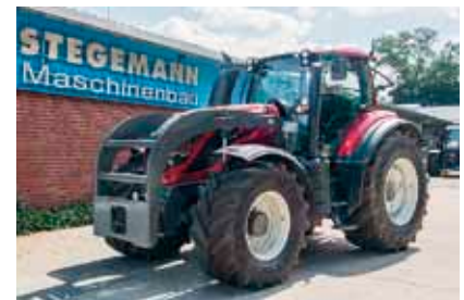
Stegmann Tragrahmen für den kommunalen Einsatz mit dem T4.

Fragen Sie noch heute Ihren Vertriebspartner und machen Sie Ihren Arbeitsalltag noch effektiver, sicherer und schöner. •