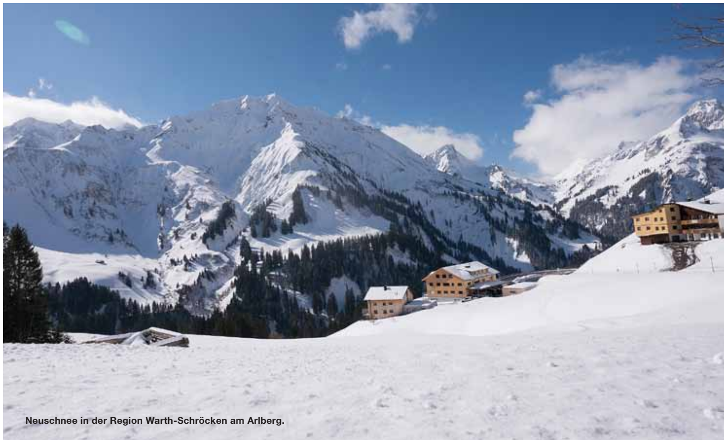
Neuschnee in der Region Warth-Schröcken am Arlberg.

In der Region Warth-Schröcken am Arlberg sorgen drei Valtra Traktoren für geräumte Straßen und Wege. Zuverlässigkeit, Robustheit und Komfort sind nur eine der Gründe, warum die Skilifte Warth und die Gemeinde Schröcken auf Traktorentechnologie aus Finnland setzen.