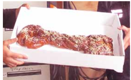
Symbolische Schlüsselübergabe in gebackener Form.

„Verschiedene Umbauarbeiten am Schlepper waren notwendig um für die Gemeinde die richtige Maschine zu liefern.“, so Markus Speck . Er und sein Team wünschen der Gemeinde unfallfreies Fahren mit dem neuen Fahrzeug. •