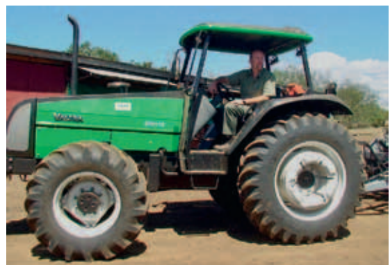
Sassi auf einem Valtra Traktor in Tansania.