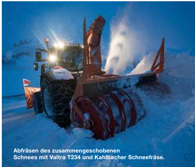
Abfräsen des zusammengeschobenen Schnees mit Valtra T234 und Kahlbacher Schneefräse.