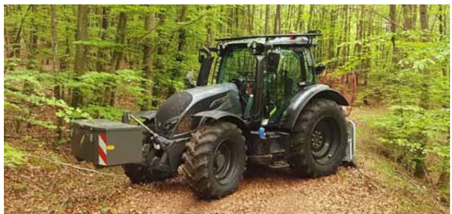
Valtra N104 der Gemeinde Eigeltingen im Forsteinsatz.