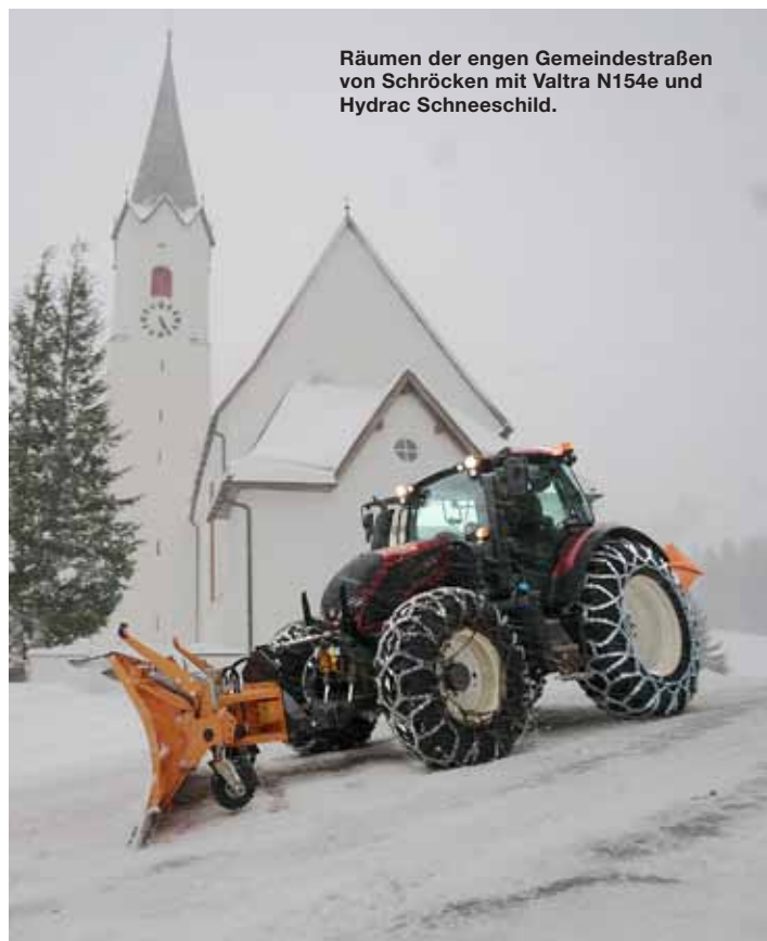
Räumen der engen Gemeindestraßen von Schröcken mit Valtra N154e und Hydrac Schneeschild.