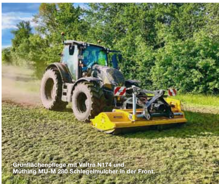
Grünflächenpflege mit Valtra N174 und Mühling MU-M 280 Schlegelmulcher in der Front.

D er Familienbetrieb aus dem Landkreis Main-Spessart betreibt schon seit mehreren Generationen Landwirtschaft. Im Jahr 2017 wurde dann die Schwab Land & Technik GbR gegründet. Grundpfeiler war der Winterdienst. Hier tritt das Unternehmen als Full-Service-Dienstleister auf. Hinzu kamen die Grünflächenpflege und Kehrarbeiten im Sommer. Und natürlich der Wegebau.