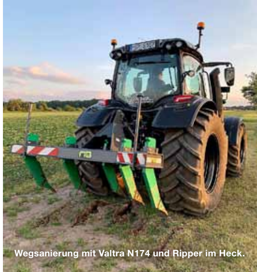
Wegsanierung mit Valtra N174 und Ripper im Heck.