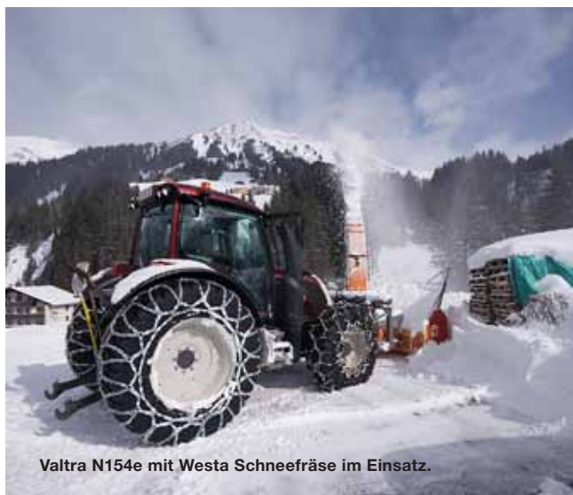
Valtra N154e mit Westa Schneefräse im Einsatz.