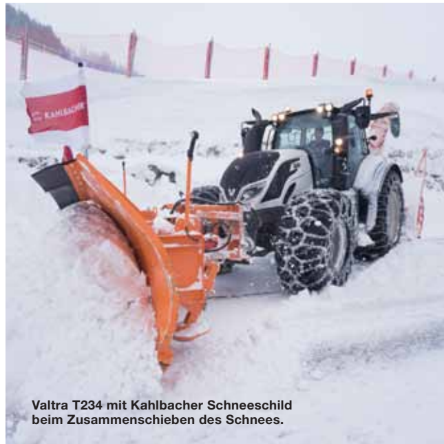
Valtra T234 mit Kahlbacher Schneeschild beim Zusammenschieben des Schnees.