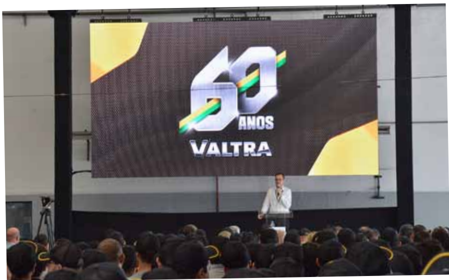
Die Feier zum 60-jährigen Jubiläum von Valtra do Brasil fand am 10. Februar 2020 in der Fabrik in Mogi das Cruzes nördlich von Sao Paulo statt.