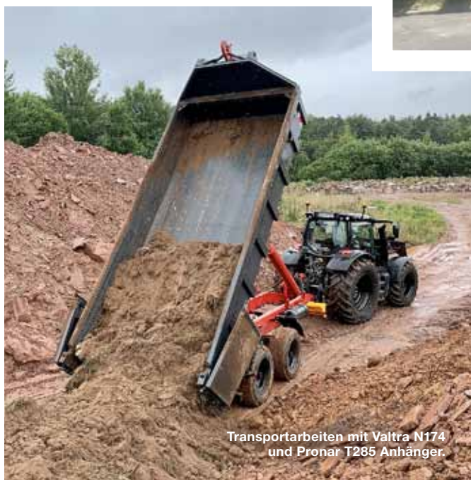
Transportarbeiten mit Valtra N174 und Pronar T285 Anhänger.