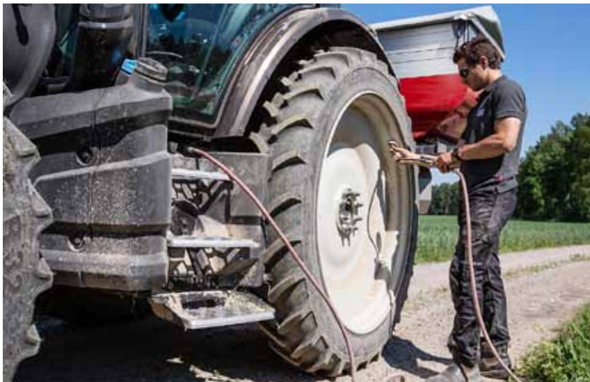
Die neue G-Serie ist mit einem seitlichen Druckluftanschluss beim Kabinenaufgang lieferbar, so dass z. B. der Reifendruck leicht eingestellt werden kann.

mit einer Hubkraft von 3 t und eine Frontzapfwelle erhältlich.