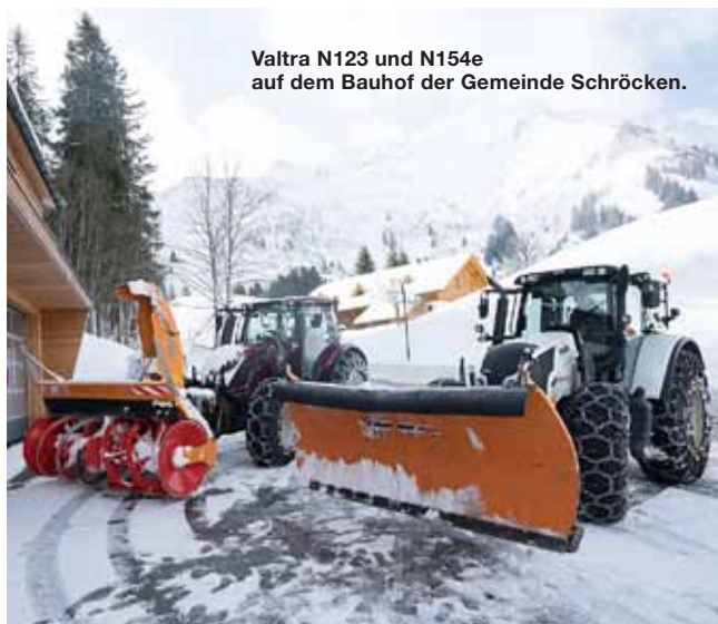
Valtra N123 und N154e auf dem Bauhof der Gemeinde Schröcken.

Video: www.valtra.de/kommunal#kundenberichte